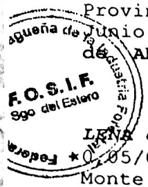
TABLA SALARIAL: para los obreros ocupados en las tareas de corte, preparación, manipuleo y transporte de los distintos productos forestales, siendo su aplicación para todo el territorio de la Provincia de Santiago del Estero, para los meses de Abril, Mayo, Junio, Julio, Agosto y Septiembre de 2019 con vigencia a partir del 1 de Abril de 2019, conforme Acta Acuerdo entre F.O.S.I.F. y A.P.I.F.